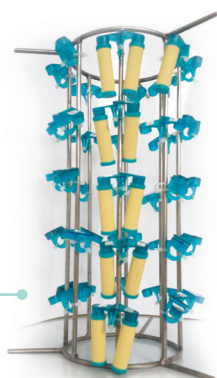
Portoir pour supports passifs